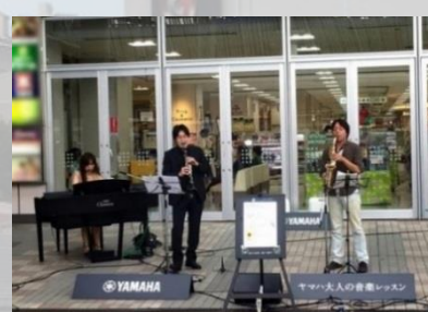
デモ演奏 (利用イメージ)