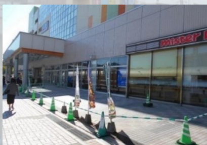
利用可能スペース