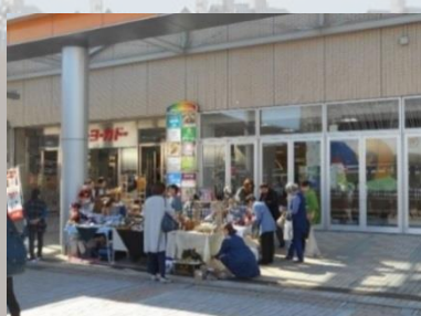
手作り雑貨・アクセサリ販売 (利用イメージ)