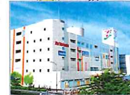
1～4階イトーヨーカ堂営業中