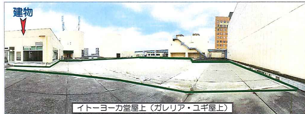
イトーヨーカ堂屋上(ガレリア・ユギ屋上)